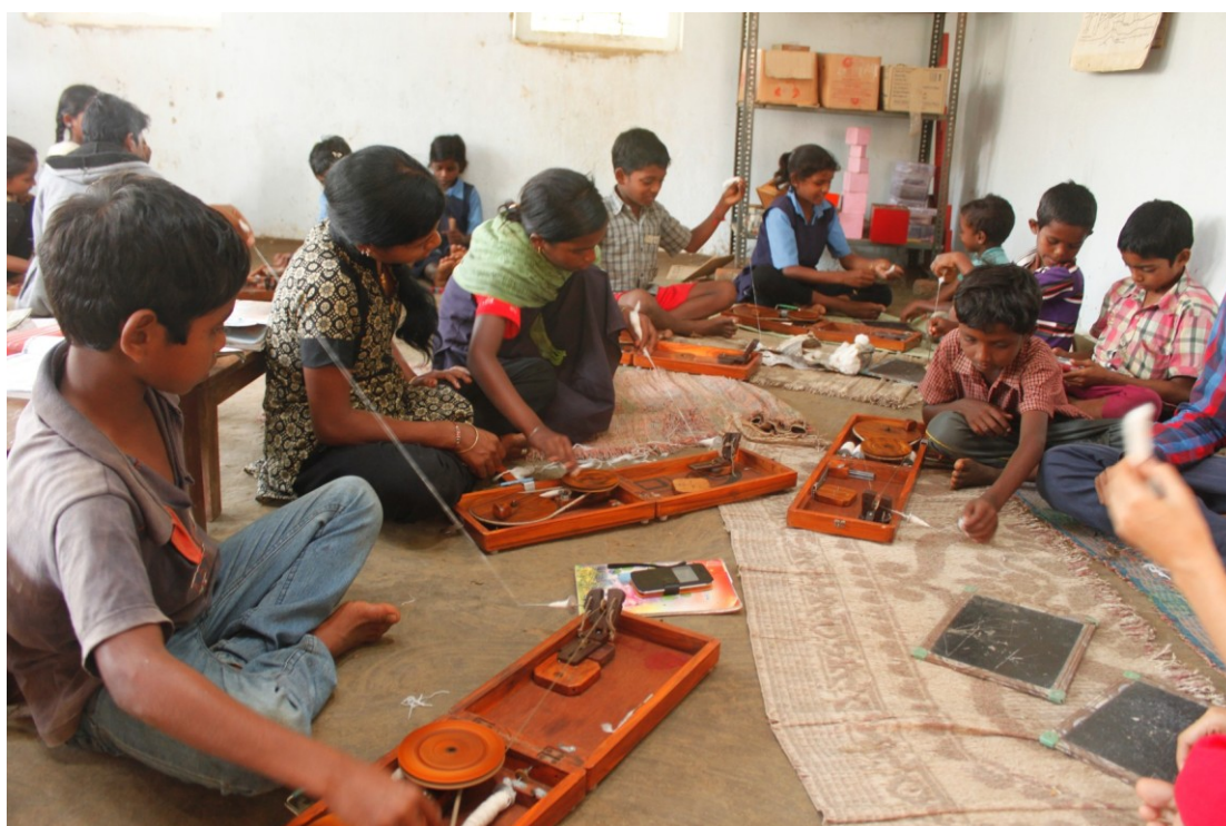
चरखे पर सूत की कताई